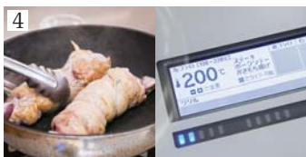
温度を自動で調整する【温度調節機能】を使うと便利です。