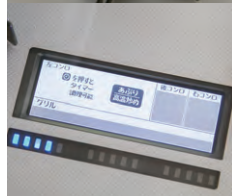
コンロの【あぶり高温炒め】機能を使うと、簡単にふわっとした卵に仕上げられます。