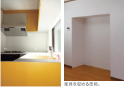
家具を取り除いた空間。