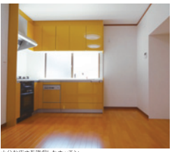
十分な広さを確保したキッチン。

「お客さまVOICE」 「旦那様も私も、リフォームをきっかけに、夫婦仲もよくなりました。」「洗面を2階に移動して、洗面スペースに「床下収納」を確保いたしました。」「動線が伸びる広さを確保したキッチンには「生活しやすい、動線の確保」を後で改めてお話しさせていただきました。」「ご提案プランをみる中で「キッチン」がポイントです。」「夫のこだわりが料理のことで、料理仲間が集まるキッチンというのを意識してプランを考えました。また、老後に安全で快適な生活を送れる家になるように配慮しました。」