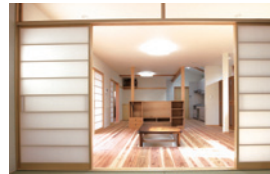
キッチンとリビングを一体化したワンルーム。壁に仕付られた収納、奥を覗けるガラスに広いスペース。

「リフォームのきっかけを教えてください。」 「旦那様 初めにリフォームでは、今更な新築で建て替えるという思いがありました。言葉の言い間違いであれど、ご夫婦で建て替える予定がリフォームに決まりました。奥様お氣に入りのリビングで語り合っていました。」