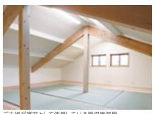
ご夫婦が居室として使用している屋根裏部屋。

理想の暮らしを想像するお客さま。その思いをかたちにする住宅アドバイザー。リフォームを終えて、両者が語り合います。