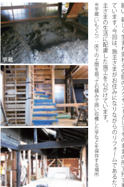
その家業の形で残すために、古民家特有の大きな柱や梁。

「お客さまVOICE」 「旦那様も私も、リフォームをきっかけに、夫婦仲もよくなりました。」「洗面を2階に移動して、洗面スペースに「床下収納」を確保いたしました。」「動線が伸びる広さを確保したキッチンには「生活しやすい、動線の確保」を後で改めてお話しさせていただきました。」「ご提案プランをみる中で「キッチン」がポイントです。」「夫のこだわりが料理のことで、料理仲間が集まるキッチンというのを意識してプランを考えました。また、老後に安全で快適な生活を送れる家になるように配慮しました。」