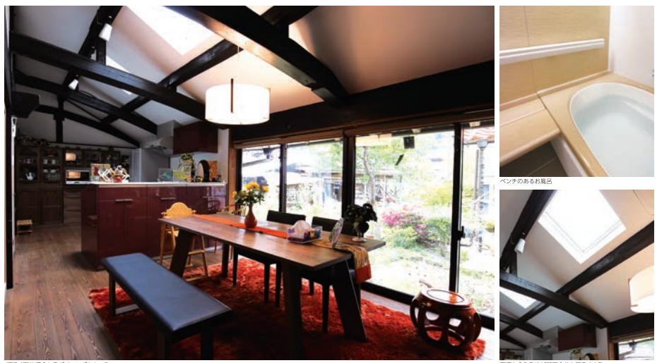
明るく開放感のあるダイニングとキッチン ベンチのあるお風呂口 天窓から入る光が部屋全体を明るくする