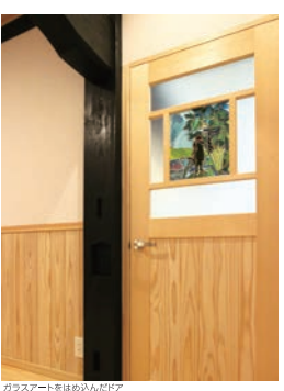
ガラスアートをはめ込んだドア