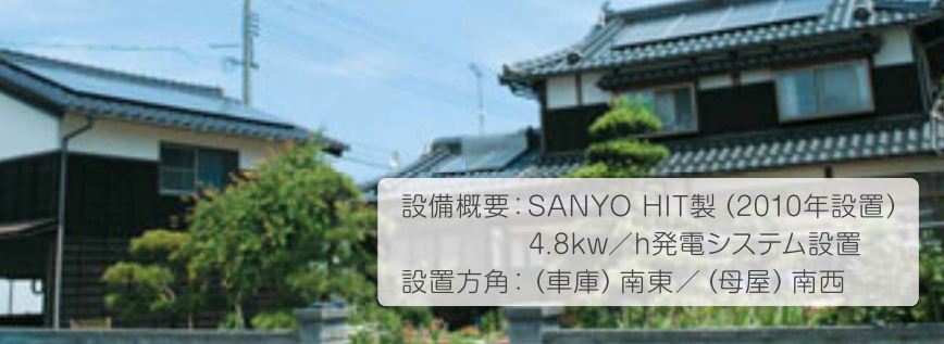
設備概要: SANYO HIT製 (2010年設置) 4.8kw/h発電システム設置 設置方角: (車庫) 南東 / (母屋) 南西

環境にも、家計にも、家族の関係にも、いい事尽くめですね♪^-^ 太陽光発電はサルーテに設置してあります。詳しい資料も取り揃えておりますので、お気軽にお申し付け下さい♪